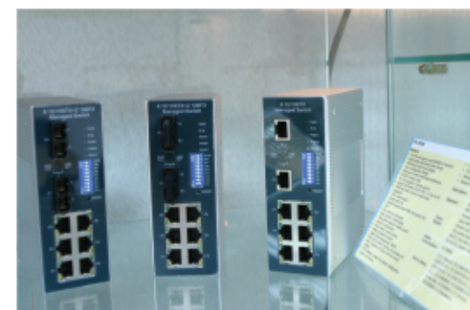
智翔網路設備產品

智翔科技 股份有限公司 ▪ 產 品：研發製造各項網路設備產品 OEM/ODM ▪ 成 立：民國75年4月 ▪ 資 本 額：400,000,000元 ▪ 員 工 數：82人 ▪ 電 話：(02)2659-2388 ▪ 地 址：台北市內湖區陽光街347號3樓 ▪ 企業網站：www.net-star.com.tw